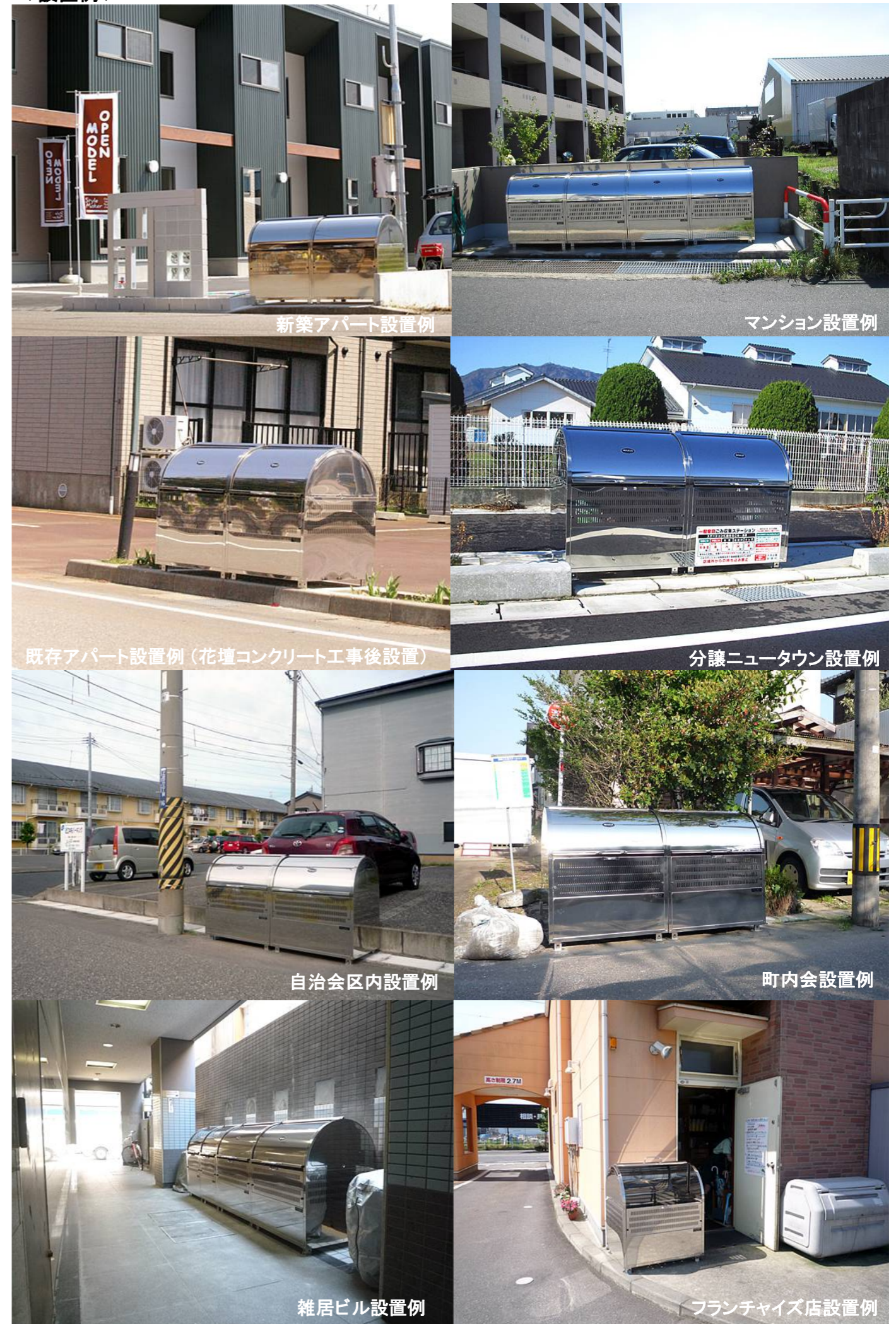
新築アパート設置例